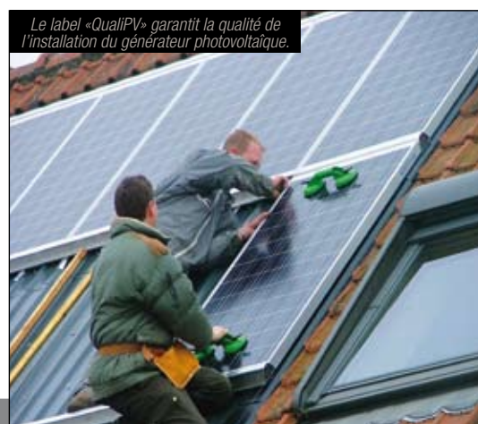
Le label «QualiPV» garantit la qualité de l'installation du générateur photovoltaïque.

Pour ne pas se disperser dans un métier où ils avaient tout à apprendre, les deux associés ont choisi de se spécialiser dans les panneaux photovoltaïques, qu'il ne faut pas confondre avec les panneaux solaires thermiques, destinés à la production d'eau chaude. Installés sur les toits, les premiers produisent une électricité qui, dans la majorité des cas, est revendue à EDF. L'objectif des pouvoirs publics est de multiplier par 400 la production d'électricité solaire, entre 2007 et 2020, pour atteindre 1% de la production globale. L'entreprise est une SAS (Société par actions simplifiée) au capital de 50 000