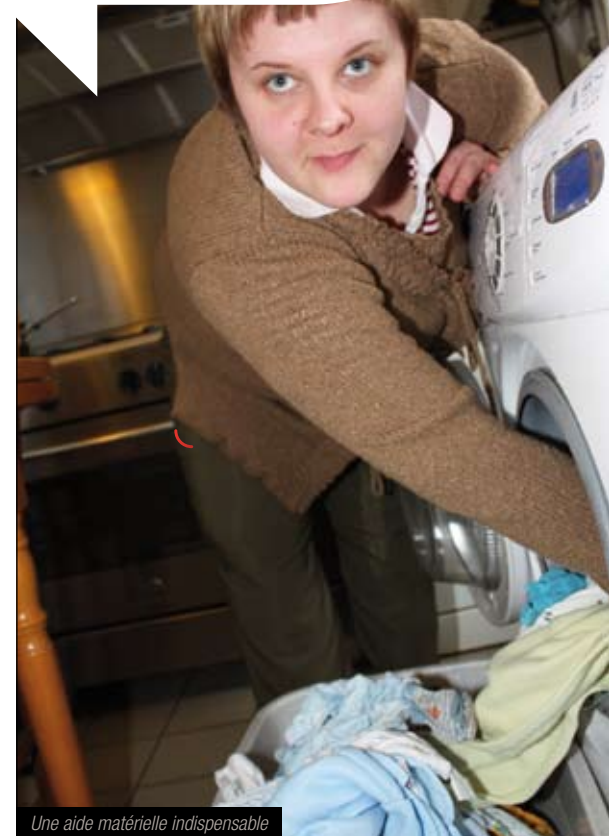
Une aide matérielle indispensable