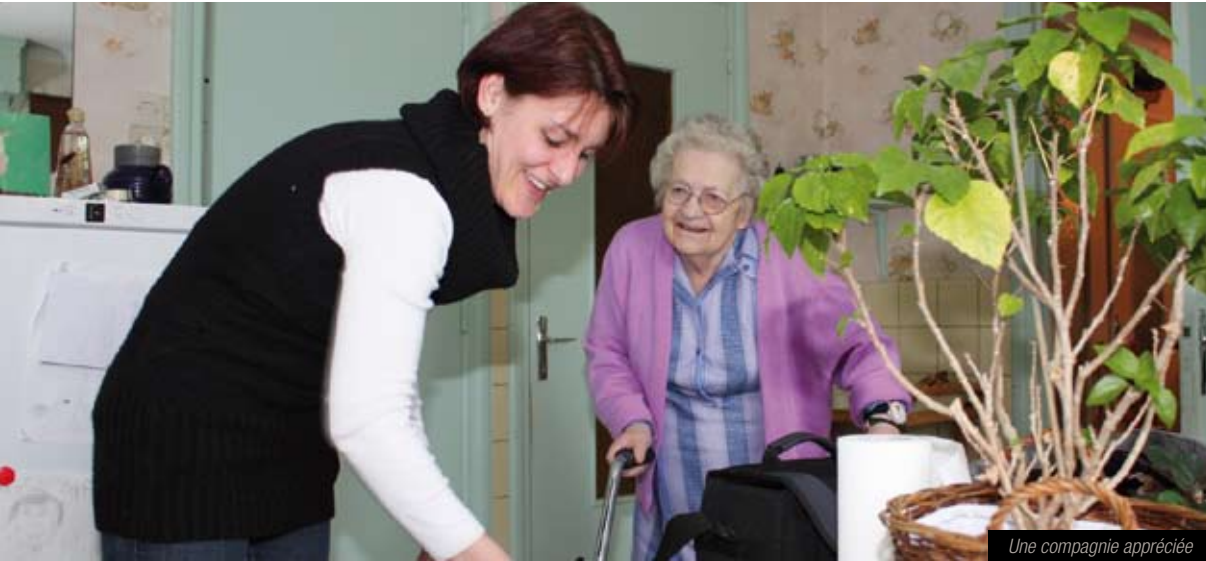
Une compagnie appréciée

Les services d'aide à domicile contribuent au bien-être quotidien de plusieurs milliers d'habitants de la Communauté de communes du pays de Pévèle, en particulier les personnes âgées.