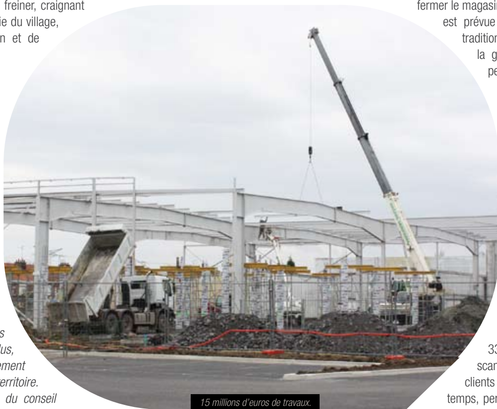
15 millions d'euros de travaux.