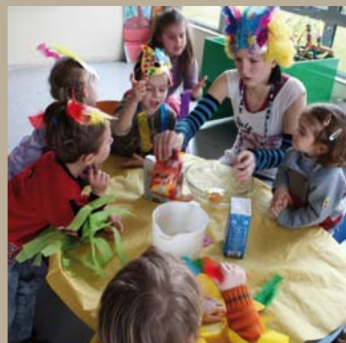
Les enfants des accueils de loisir sans hébergement s'en sont donné à cœur joie durant les vacances de février, notamment pour le traditionnel mardi gras.

Directeur de la publication : Luc MONNET Directeur de la rédaction : Henri CAUDRELIER Rédaction : Carmela VICENTE, CC-pays de Pévèle Photos : CC-Pays de Pévèle sauf mention contraire Illustrations covoiturage : roulez-malin.fr Création / Fabrication : STUDIO-GLUKOZ - tél. 09 516 578 71 Impression : L'ARTESIENNE - labellisé Imprim'vert Tirage : 17 000 exemplaires N° ISSN : 1634-6912 CC-Pays de Pévèle : tél. 03 20 79 20 80