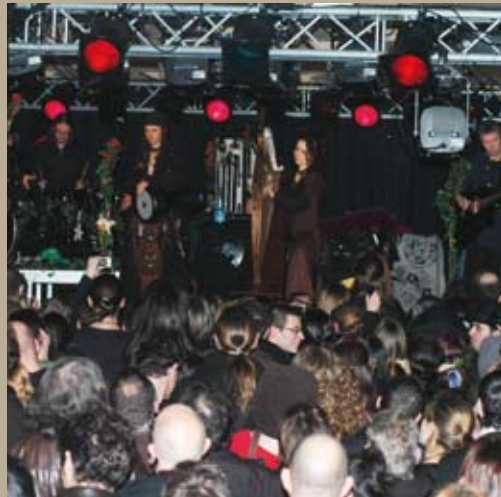
Le public s'était déplacé en nombre pour le premier concert en France du groupe Celtique «Omnia» à Cappelle-en-Pévèle le 24 janvier.

Président de la Communauté de communes du pays de Pévèle Conseiller général Maire de Templeuve