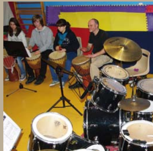
Soirée rythmée ce lundi 16 février pour une audition des classes de batterie et de djembé de l'école de musique en pays de Pévèle à Bersée.