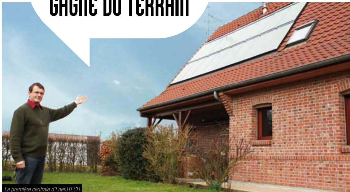
La première centrale d'EnerJTECH

Le recours aux énergies renouvelables n'est plus un concept réservé à une poignée d'écolos farfelus, hyper bricoleurs ou fortunés. C'est un choix de vie et un investissement pour l'avenir, et se sera très bientôt une obligation légale. En vedette, le soleil, source inépuisable d'énergie gratuite et non polluante. Même dans le Nord.