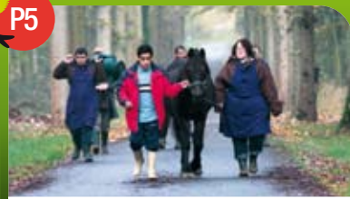
La Ferme aux Bois de Genech