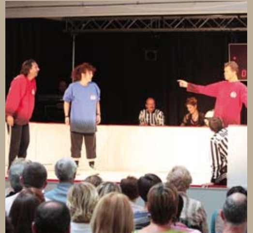
La saison 2009/2010 des Rencontres Culturelles en Pévèle a débuté sous les rires de plus de 300 personnes venues assister au match de la ligue d'improvisation de Marcq-en-Baroeul.