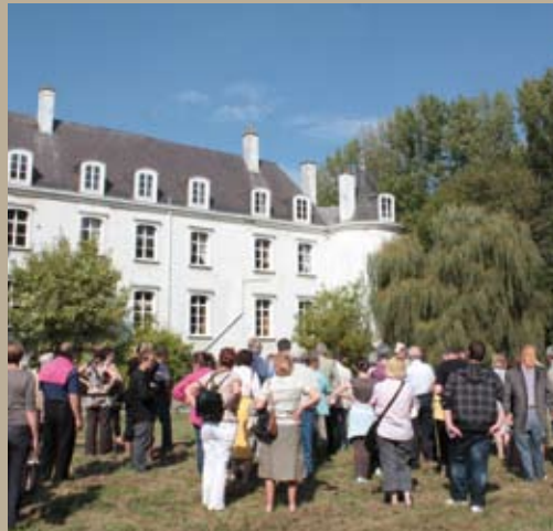
Consacrées aux châteaux, les journées du patrimoine ont permis à de nombreuses personnes de replonger dans l'histoire de bâtiments hors du commun à Cysoing et Bersée.

Président de la Communauté de communes du pays de Pévèle Conseiller général Maire de Templeuve