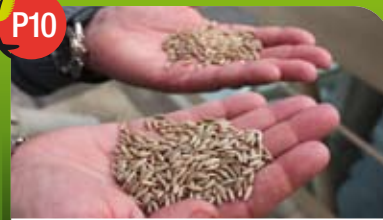
Le bon grain de la Pévèle