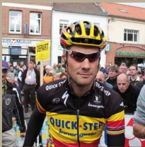
Tom Boonen, triple vainqueur du Paris-Roubaix, a gagné à l'applaudimètre lors de la présentation des équipes professionnelles du tour de France au départ de l'étape Templeuve-Mouscron du circuit Franco-Belge 2009.