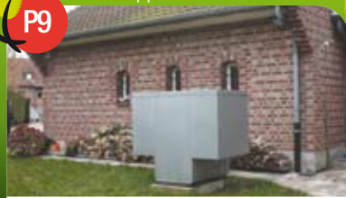
L'aérothermie à le vent en poupe