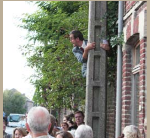
En plus de la découverte des châteaux, les participants aux journées du patrimoine ont vécu des visites particulièrement loufoques des communes d'Avelin et de Cobrieux avec la compagnie « La vache bleue ».