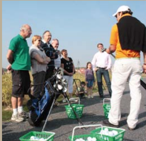
Mérignies golf ouvrait ses portes aux pévélois pour des initiations gratuites dans le cadre de la 1ère coupe du Pays de Pévèle organisée le 27 septembre dernier.