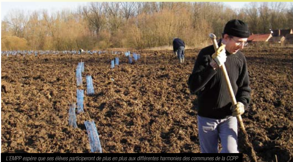
L'EMPP espère que ses élèves participeront de plus en plus aux différentes harmonies des communes de la CCPP

100 heures de formation par modules, adaptés à leurs besoins : bilan de compétences, initiation à l'informatique, secourisme, remise à niveau figurent parmi les modules les plus prisés. Toujours en fonction de leur projet individuel défini en concertation avec les accompagnateurs, les salariés suivent ensuite une formation de découverte des métiers qui leur permet de s'orienter selon leurs aptitudes et leurs goûts : espaces verts, bâtiment, nettoyage, aide à la personne... Tout ne s'arrange pas d'un coup de baguette magique, mais avoir renoué des liens avec le monde du travail est essentiel.