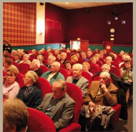
A l'occasion de la semaine bleue 2009, les seniors de la Pévèle étaient invités par la CCPP aux cinémas de Templeuve pour découvrir le film « Tellement proche ».

Directeur de la publication : Luc MONNET Directeur de la rédaction : Henri CAUDRELIER Rédaction : Carmela VICENTE, CC-pays de Pévèle Photos : CC-Pays de Pévèle sauf mention contraire Création / Fabrication : STUDIO-GLUKOZ - tél. 09 516 578 71 Impression : L'ARTESIENNE - labellisé Imprim'vert Tirage : 16 500 exemplaires N° ISSN : 1634-6912 CC-Pays de Pévèle : tél. 03 20 79 20 80